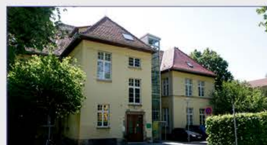
Haus 19 - Sozialpädiatrisches Zentrum