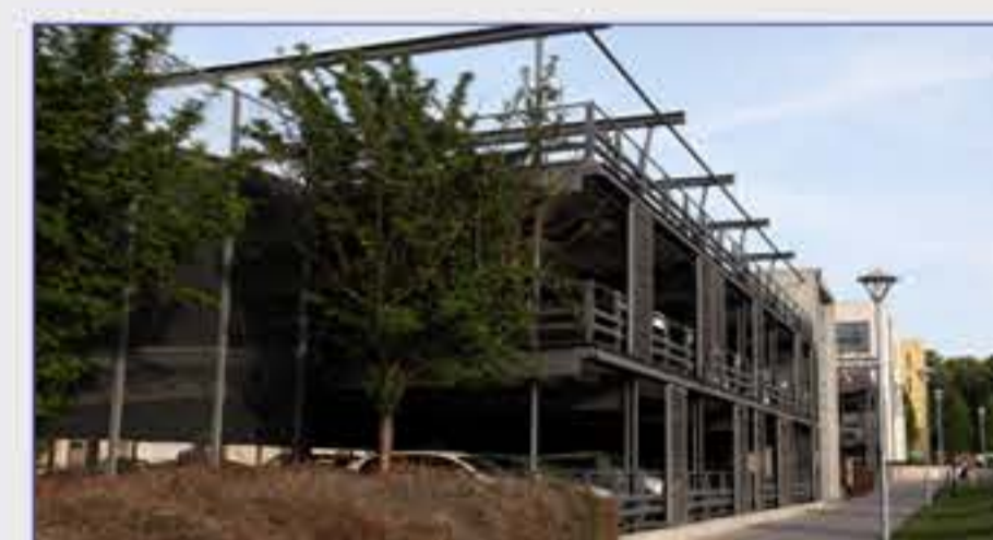
Haus 66 - Parkhaus Zufahrt über die Marie-Elise-Kayser-Straße