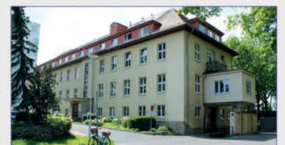
Haus 27 - Betriebsarzt, Einkauf