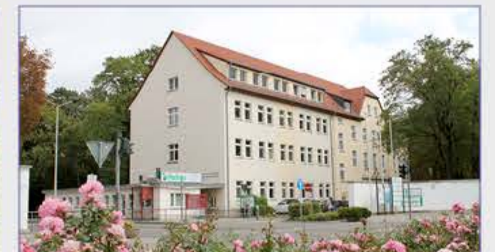
Haus 11 - Hauptpforte und Verwaltung / Klinikgeschäftsführung