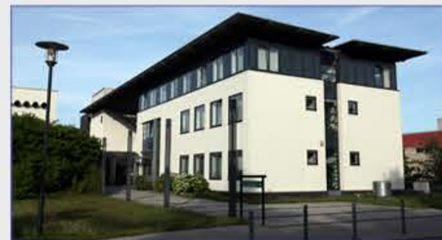
Haus 4 - Strahlenklinik