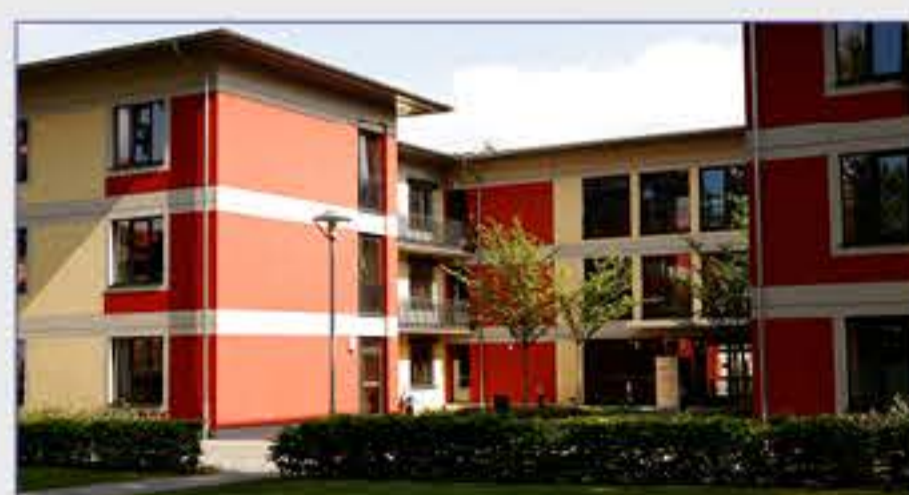
Haus 15 - Psychiatrie, Psychotherapie und Psychosomatik