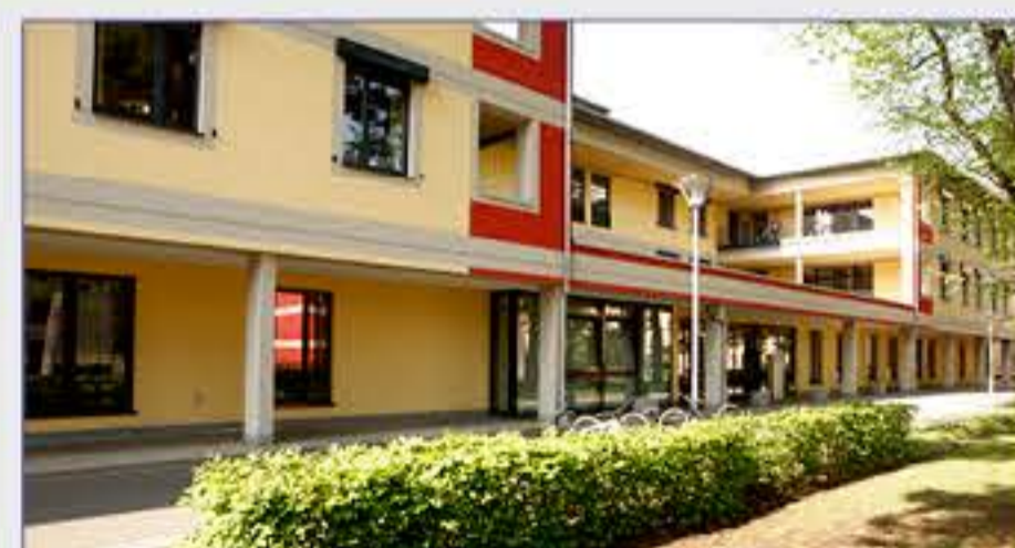
Haus 13 - Zentrum für Geriatrie