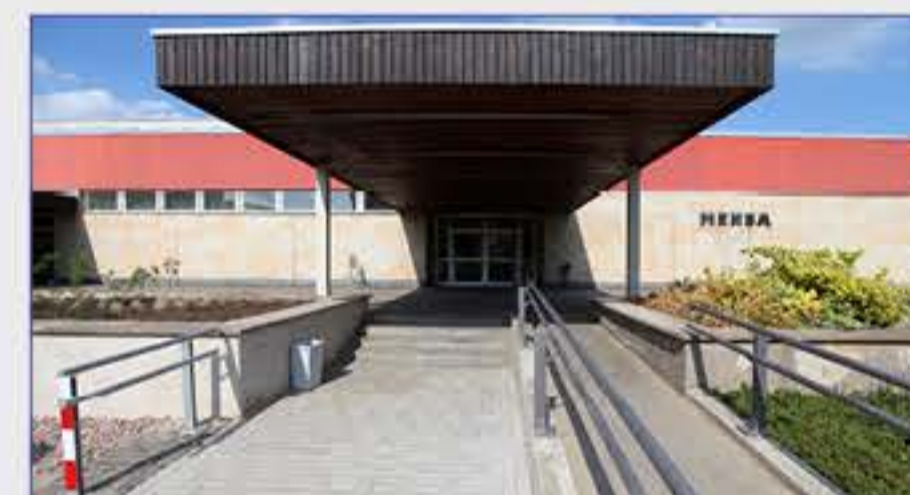
Haus 5 - Mensa/Impfstelle der Kassenärztlichen Vereinigung Thüringen