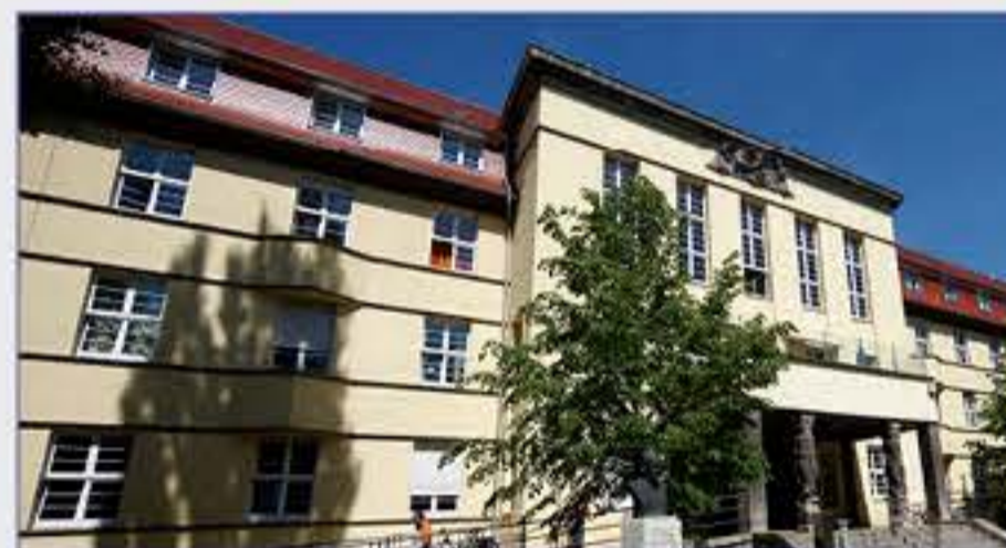
Haus 3 - Frau-Mutter-Kindzentrum