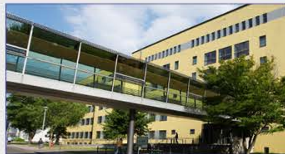
Haus 2 - Gebäude für Innere Medizin und Hautkrankheiten mit Auditorium (EG)