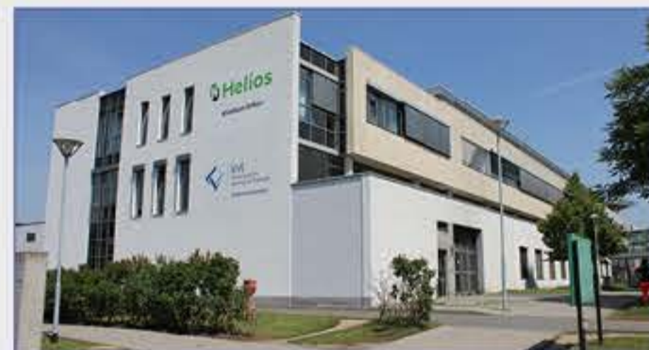
Haus 1 - Hauptgebäude mit Haupteingang - Rezeption/Aufnahme - Cafeteria - Geldautomat - Einkaufsmöglichkeit