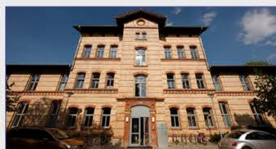
Haus 14 - Kinder- und Jugendpsychiatrie, Psychotherapie und Psychosomatik